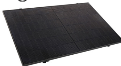
Kodak 450W full Black Bi-facial TOPCON

Garantie de 30 ans pour le système Kodak Solar Kit, garantie produit de 30 ans pour les modules et garantie de puissance linéaire de 30 ans, garantie produit de 15 ans pour le micro-onduleur.